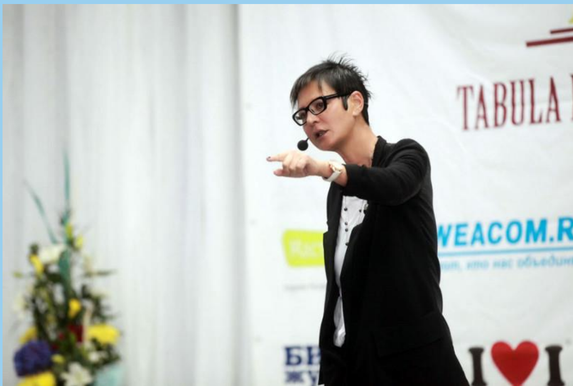
Ирина Хакамада Публицист