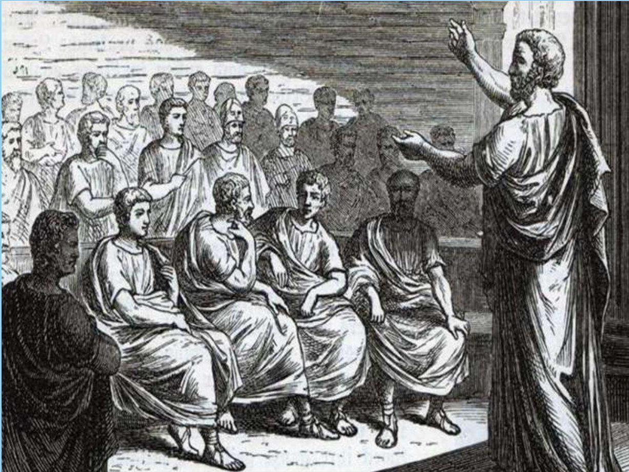
Демосфен Греческий оратор

Ораторское искусство – это способность человека грамотно, доступно, в понятной для аудитории форме донести до слушателей собственную позицию. Выступающий обязан умело и гармонично использовать в своей речи определенные приемы подачи материала, актерские, психологические и речевые навыки для удержания внимания и убеждения слушателя.