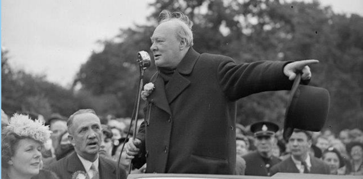
Уинстон Черчилль Бывший Премьер-министр Великобритании