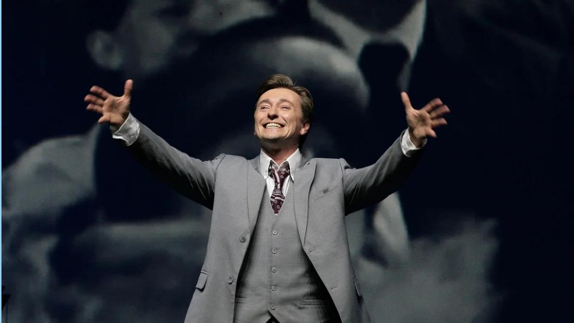
Сергей Безруков Актер