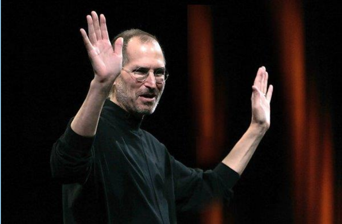
Стив Джобс Предприниматель