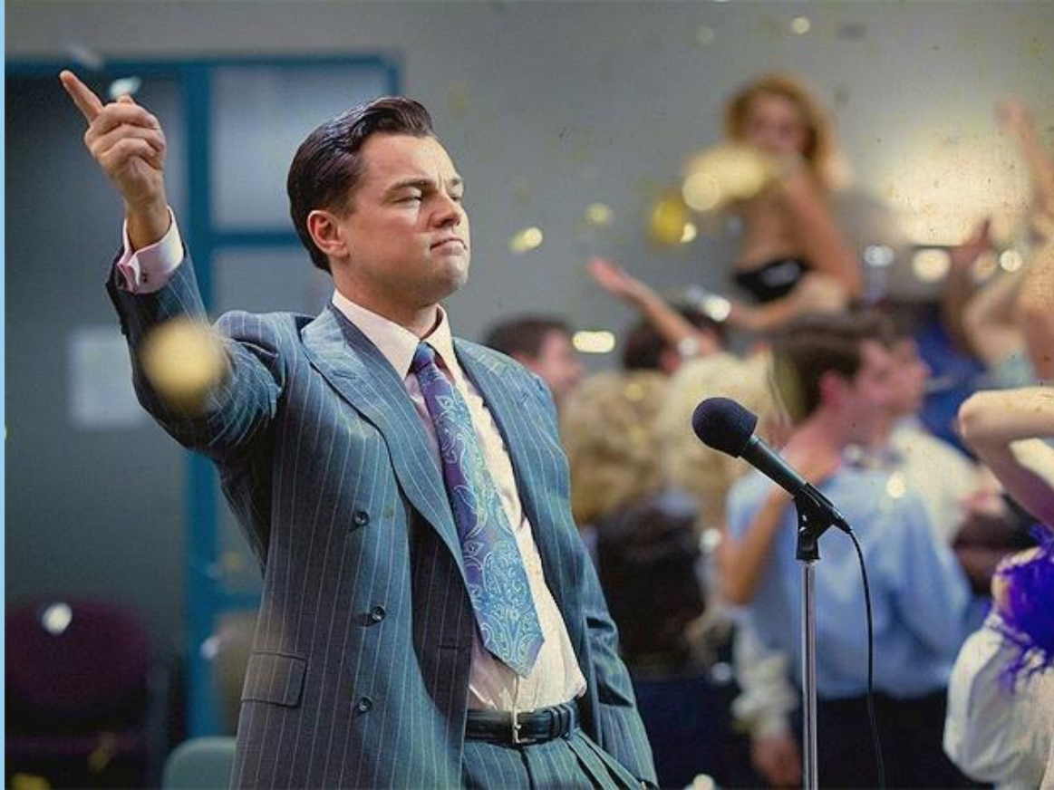
Кадр из фильма «Волк с Уолл-стрит» Актер Леонардо Ди Каприо

Обладание дикционной выразительностью, поставленным голосом, а также умение владеть ситуацией и находить общий язык с любой аудиторией – это нужные навыки, которые могут пригодиться в любой жизненной ситуации.