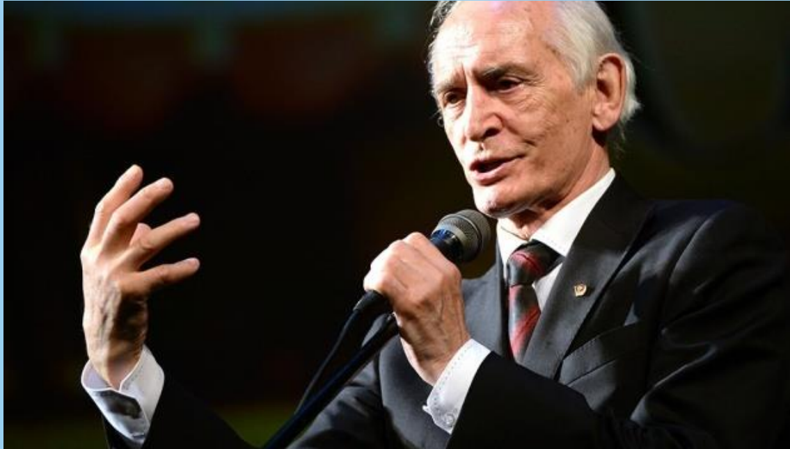
Василий Лановой Актер